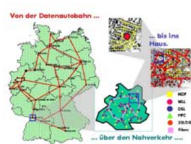
Bild 14.1 Von der Datenautobahn bis ins Haus

blick über die für Kommunikationsnetze benötigte Infrastruktur. Der Fernverkehr zwischen den grössten Städten in Deutschland wird über die "Datenautobahn" abgewickelt, bzw. über sogenannte "Back-Bone" Netze. Weiterhin gibt es ein Transportnetz im Stadtbereich, die sogenannten "Metronetze", sowie die Verkehrswege, die bis zum Teilnehmer ins Haus führen, die sogenannten "Zugangsnetze" bzw. "Teilnehmeranschlussnetze". Im Unterschied zum Individualverkehr im Strassennetz ist der Transport in den Kommunikationsnetzen allerdings völlig automatisiert, d.h. die Bits reisen als "Frachtgut".