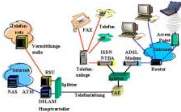
Bild 14.3 Teilnehmeranschluss mit ADSL und ISDN